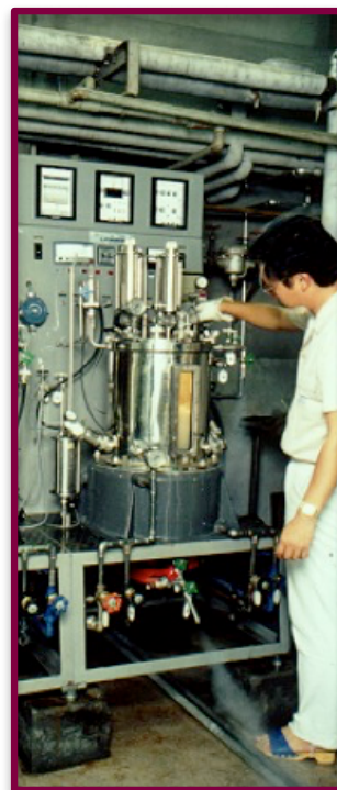
大量液体培養 (ジャーファーマンター)