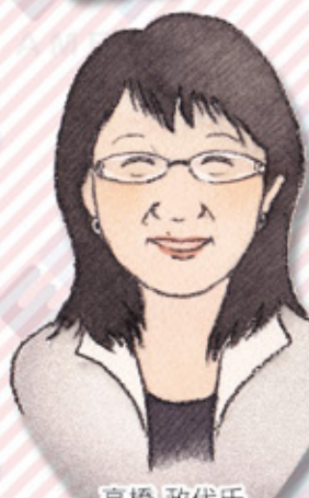
高橋 政代氏 (理化学研究所)