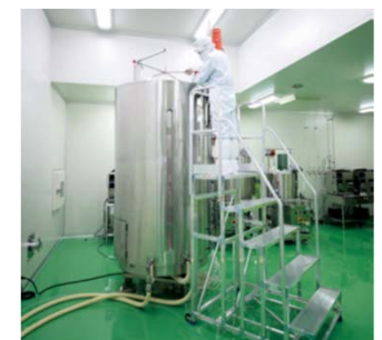
2000Lスケールシングルユースバイオリクター (バイオ医薬品の高度製造技術の開発)