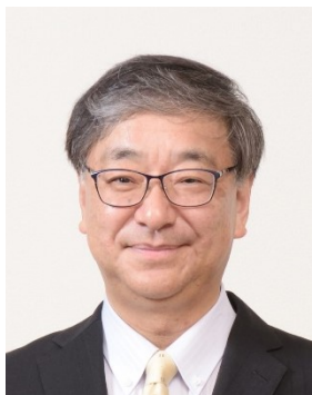
中山 俊憲 (千葉大学 学長)