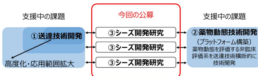
図 1 DDS 評価研究体制に対する公募・シーズ開発研究の位置付け

※3： https://www.kantei.go.jp/jp/singi/kenkouiryoyou/iyakuhin/dai9/siryoyou4.pdf 資料 4 の 7 頁