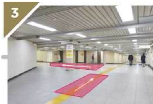
開けた三叉路を左に曲がります。