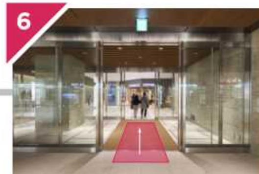
正面が「COREDO室町テラス」です。