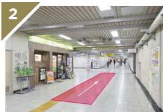
NewDaysを左手に見ながら直進します。