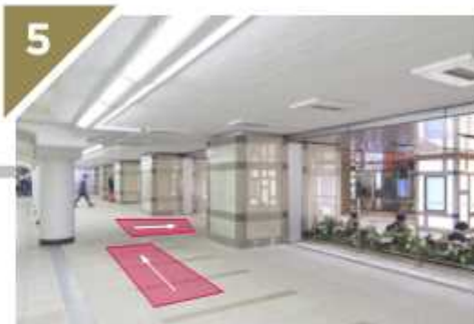
「三越前駅」の手前で右に曲がります。