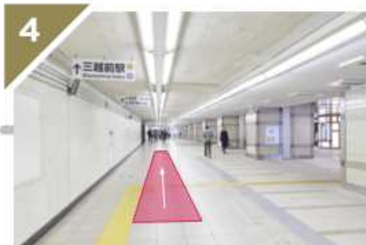
「三越前駅」方面へ向かいます。