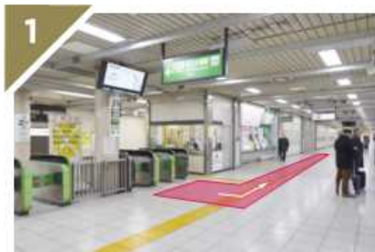
改札口を出たら左に進みます。