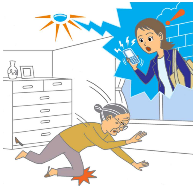
重点分野のイメージ