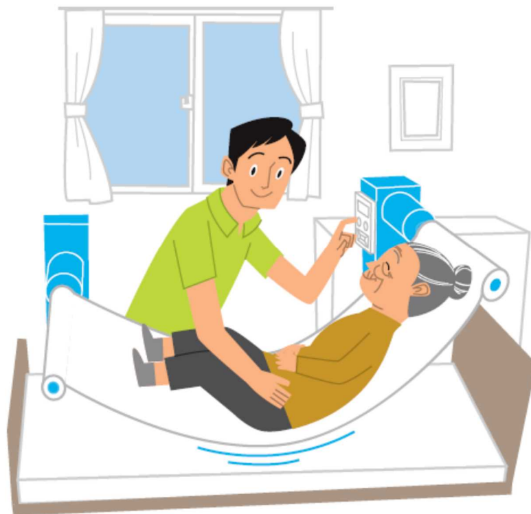
重点分野のイメージ