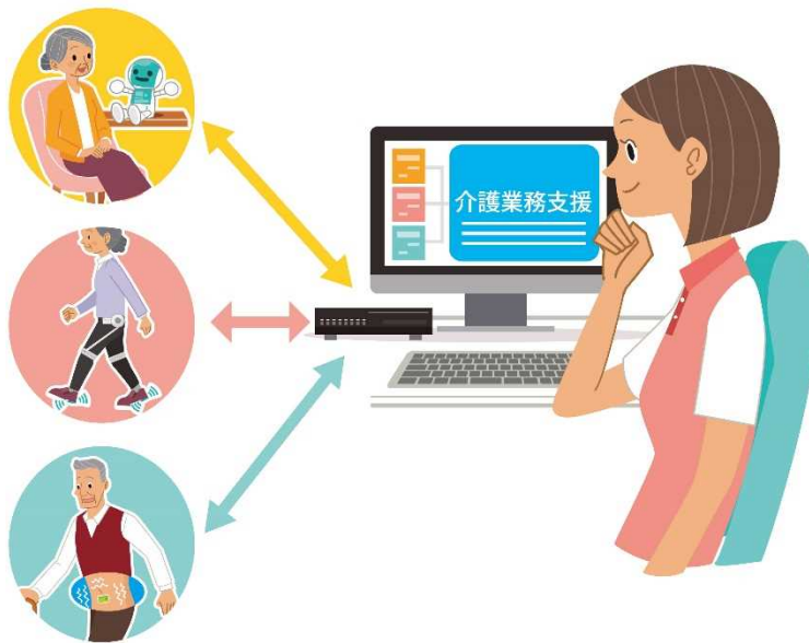
重点分野のイメージ