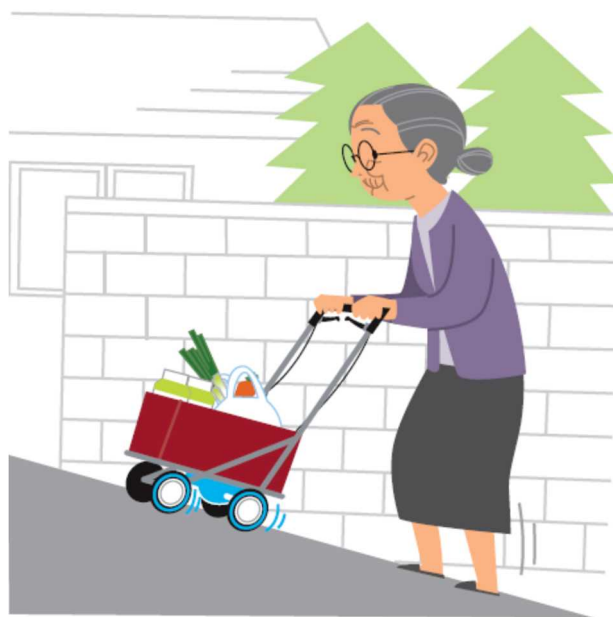
重点分野のイメージ