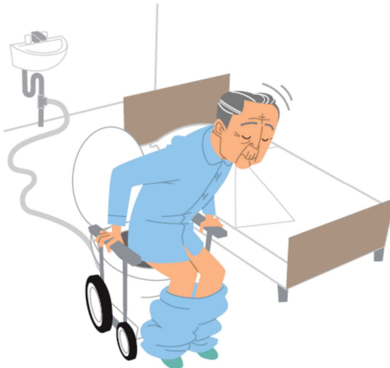
重点分野のイメージ