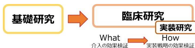
図 概念図：実装研究

日本の医療が持つ優れた医療技術の海外での活用は、我が国の経済効果をもたらすのみならず、低・中所得国における持続可能な開発目標（SDGs）達成目標の一つでもあるユニバーサルヘルスカバレッジ（UHC）の推進、開発途上国の保健システムの強化・整備への国際貢献に繋がる重点政策の一つです。この達成を目指し、医療機器・医薬品開発における信頼性確保、効率化や標準化の中で、世界的には国際共同実装・臨床研究が積極的に展開されています。令和 6 年度は、1) 低・中所得国の健康・医療問題改善に向け、(A) 我が国で承認された医療機器・医療技術・医薬品の有効性、安全性、効率性等を評価するための国際共同チームでの実装・臨床研究や、(B) 我が国で承認されているものの、対象国の臨床現場で導入・普及されていない医療機器・医療技術等の実装研究を推進します。また、2) Global Alliance for Chronic Diseases (GACD) と連携し、多疾患併存状態患者の管理とケアを最適化するための実装研究に関する国際臨床共同研究を推進します。得られた知見をもとに、対象国において、新たな診断法・治療法・予防法の実用化・実装化を目指します。