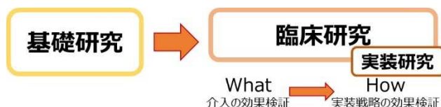
図 概念図：実装研究

日本の医療が持つ優れた医療技術の海外での活用は、我が国の経済効果をもたらすのみならず、低・中所得国における持続可能な開発目標（SDGs）達成目標の一つでもあるユニバーサルヘルスカバレッジ（UHC）の推進、開発途上国の保健システムの強化・整備への国際貢献に繋がる重点政策の一つです。この達成を目指し、医療機器・医薬品開発における信頼性確保、効率化や標準化の中で、世界的には国際共同実装・臨床研究が積極的に展開されています。令和 6 年度は、1) 低・中所得国の健康・医療問題改善に向け、(A) 我が国で承認された医療機器・医療技術・医薬品の有効性、安全性、効率性等を評価するための国際共同チームでの実装・臨床研究や、(B) 我が国で承認されているものの、対象国の臨床現場で導入・普及されていない医療機器・医療技術等の実装研究を推進します。また、2) Global Alliance for Chronic Diseases（GACD）と連携し、多疾患併存状態患者の管理とケアを最適化するための実装研究に関する国際臨床共同研究を推進します。得られた知見をもとに、対象国において、新たな診断法・治療法・予防法の実用化・実装化を目指します。