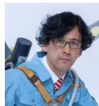
株式会社 明和電機

富士通株式会社 未来社会&テクノロジー本部 Ontennaプロジェクトリーダー/サイエンスアゴラ 2022推進委員