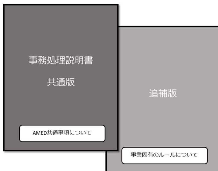
図 1. 事務処理説明書の構成

※本事業は「革新的研究開発推進基金補助金取扱要領」および「革新的研究開発推進基金補助金補助金交付決定通知書」の別紙に基づき実施されます。これらを必ずご確認ください。補助事業を実施してください。