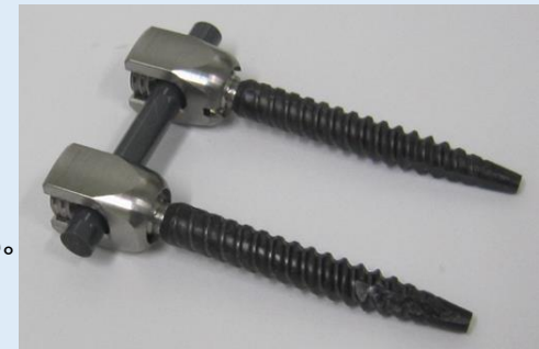
クラスⅢ 世界最高強度のCFRP製脊椎デバイス