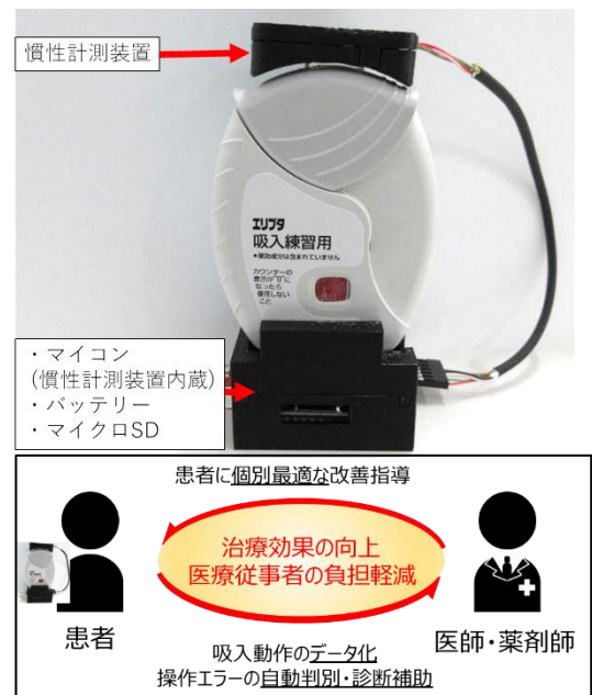
図1. デバイス外観と使用による効果

気管支喘息等の呼吸器系の疾患の治療には、薬剤吸入器が広く使用されています。吸入器を用いて服薬を行う吸入療法は極めて有効な治療法ですが、半数以上の患者が不適切な使い方により薬剤を十分に吸入できていないと言われており、医師や薬剤師等の医療従事者による綿密な対面指導が不可欠となっています。このデバイスでは、慣性計測装置を用いることで薬剤吸入時の蓋開け・傾きなどの動作を検知し、吸入が正しく行われたかどうかを判定することが可能です。本デバイスを用いることで患者の吸入器使用状況のモニタリングが可能となり、医療従事者の負担軽減及び吸入薬による治療効果の向上が期待されます(図1)。