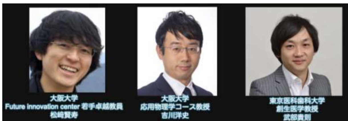
図 3: 3人の責任著者