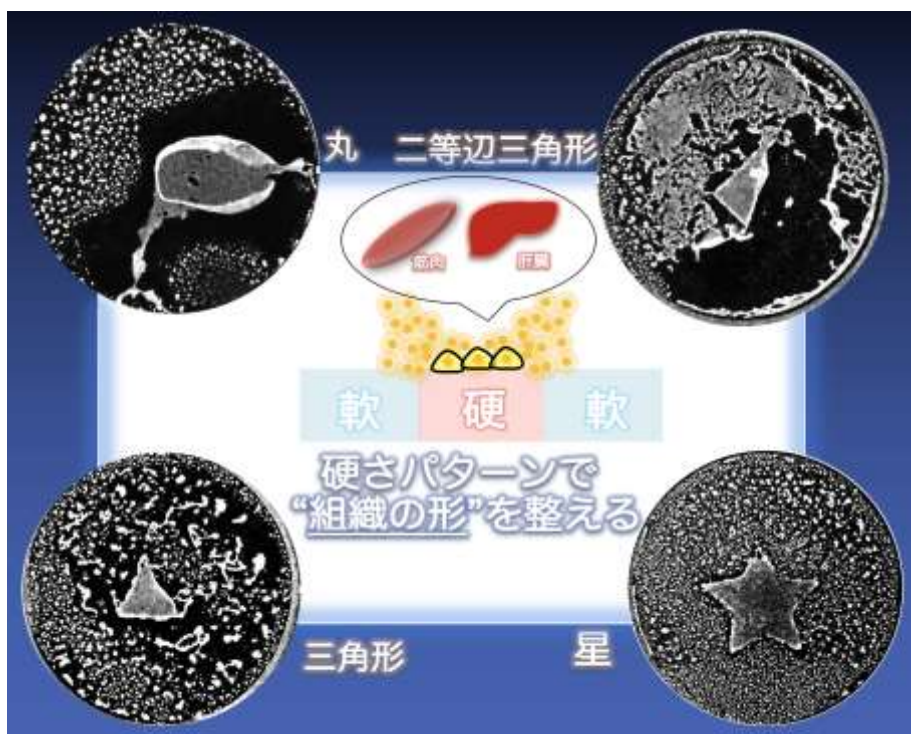
図 2:硬さの空間パターンに応答して形を変える細胞組織

本研究チームは、高分子で作製した培養基板の中心にわざと硬い領域を混ぜ込むと、その中心に向かって細胞運動が促され、組織形成の“おへそ”になることを発見しました。本高分子は光照射により固まる性質を有するため、おへその形を円、二等辺三角形、星へと様々な形の空間パターンを作製することができます。本研究グループでは、組織の形が、硬さの空間パターンに応答して多様に変化することがわかりました(図2)。