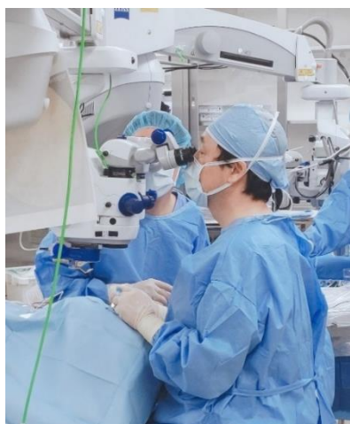
移植手術の様子