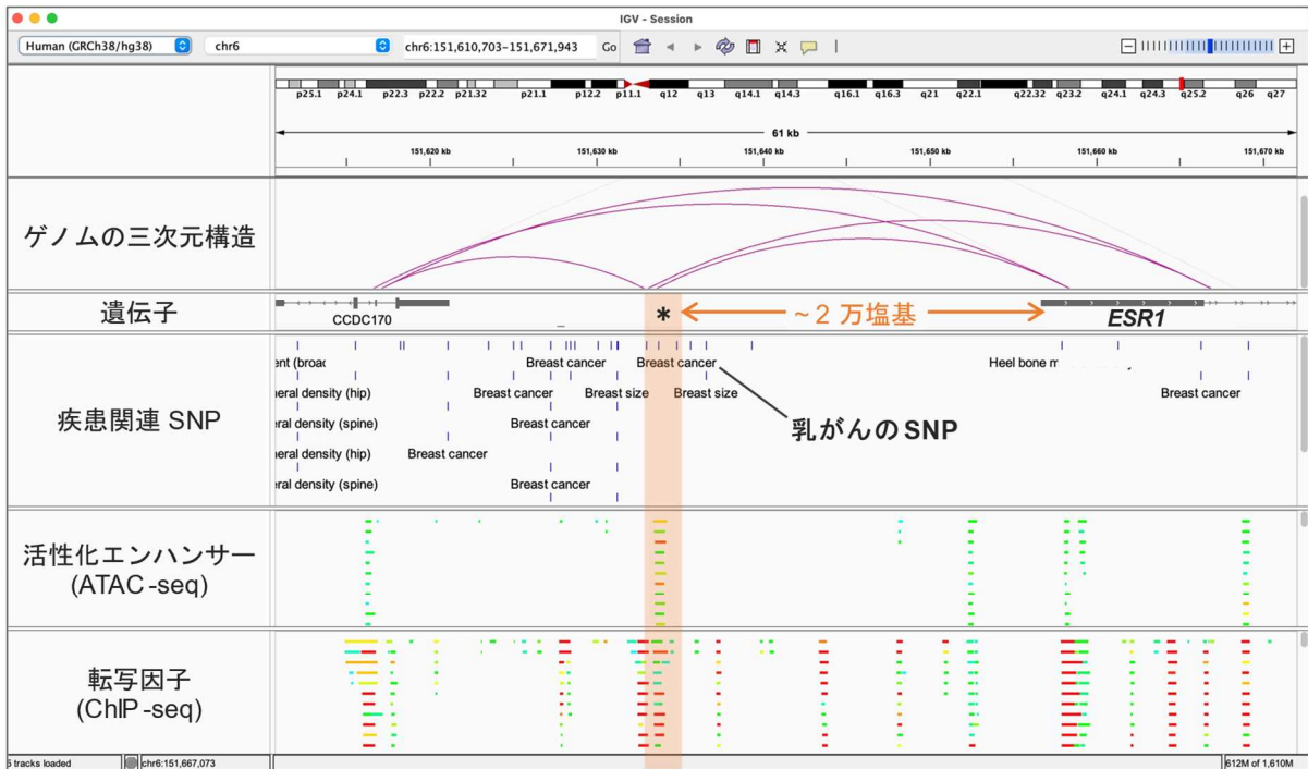
図 2 疾患関連 SNP 周辺エピゲノム状態の可視化

ここからは利用事例を示しながら、Annotation Track について説明します。例えば、ATAC-seq と ChIP-seq データから、乳がんの発生に寄与するエストロゲン受容体をコードする ESR1 遺伝子の周辺に複数の活性化エンハンサー領域が存在することを理解できます（図 2）。