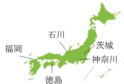
図 1. 調査地域

茨城県、神奈川県、石川県、福岡県、徳島県において3歳児および3歳6ヶ月児健診を実施する保健センター15 箇所において、調査を実施しました(図1)。具体的には、健診に参加した子どもの保護者に対し、①吃音の症状がある(過去にあった)か否か、②子どもの言語発達や家族の状況など(過去の研究で吃音に関係があると報告された特徴)を尋ねる質問紙を配布し、回答を依頼しました。質問紙で「吃音がある(あった)」と回答した対象者には、子どもが本当に吃音の症状を示しているかを確認するため専門家がさらなる調査を実施しました。具体的には、子ども本人と話をし、あるいは保護者に吃音の症状を詳細に説明してもらい、実演してもらいなどです。これらの確認調査に協力が得られなかった、あるいは回答が曖昧で吃音の有無を確定させられなかった少数のケースを除いて、調査時点で吃音のあった子どもの割合(有症率)と、調査時点までに吃音の経験をしている子どもの割合(累積発症率)を計算しました。そして、3歳時点で吃音が見られた群と、吃音を全く経験していない群との発達状況や家族の状況を比較しました。