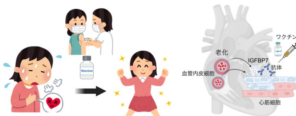
ワクチンで心不全を治療